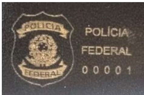
FIGURA 4 - GRAVAÇÃO NA ABA Nº 1, VISÃO EXTERNA (IMAGEM MERAMENTE ILUSTRATIVA)

1.15. O visor plástico, que será aplicado na aba nº 2, visão interna – FIGURA 1, será composto de um corte retangular de PVC (Filme Plastificado Composto 100% Policloreto de Vinila), tipo cristal transparente, com espessura mínima de 0,30 mm, com gramatura de 220g/m2 a 270 g/m2, a transparência mínima é de 90,0%, incolor.