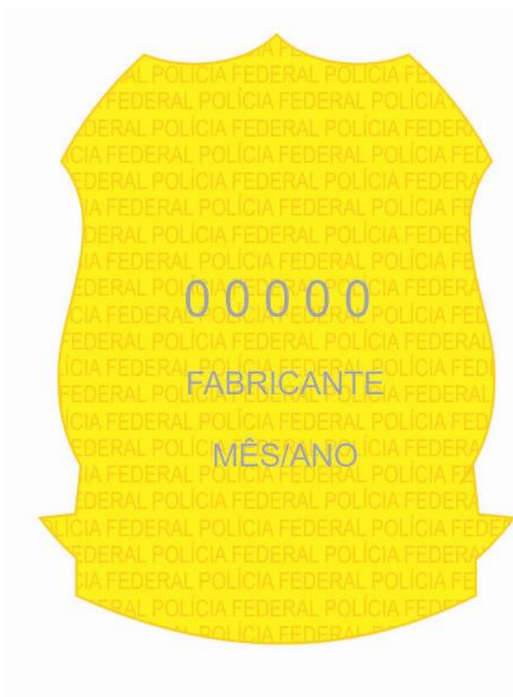
FIGURA 6 - VERSO DO DISTINTIVO METÁLICO

1.26. No coração do emblema destacam-se as armas nacionais que se descrevem segundo a Lei nº 5.700, de 1º de setembro de 1971, na forma que segue: